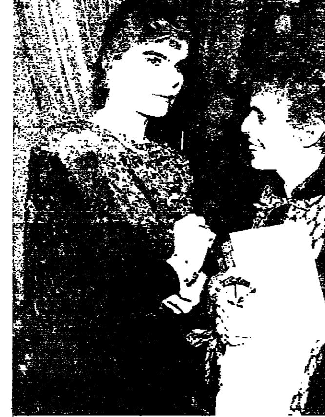
حفيدة من حفلة اسمه ال همنغواي. ابن الحفيدة من الجد